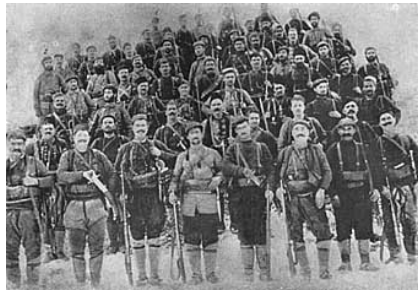
Четите от серското револуционно окръжие, февруари 1903 г., събор в Алиботуш планина